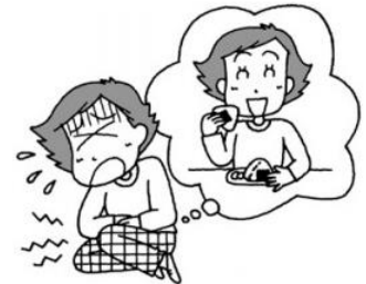
活動中、食べた弁当で、 ボランティア自身が食中毒になった