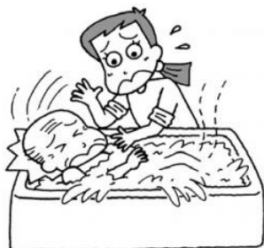
入浴ボランティア活動中、誤ってお年寄りにケガをさせた