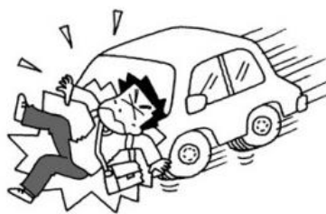
ボランティア活動に向かう途中、 交通事故にあった