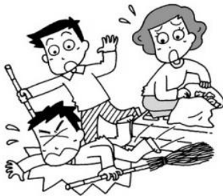
清掃ボランティア活動中、 転んでケガをした