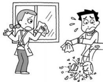
家事援助ボランティア活動で、清掃中に誤って花瓶を落とした